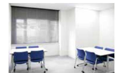
●控室は2階に4室を完備。 (2階ホールB-3)