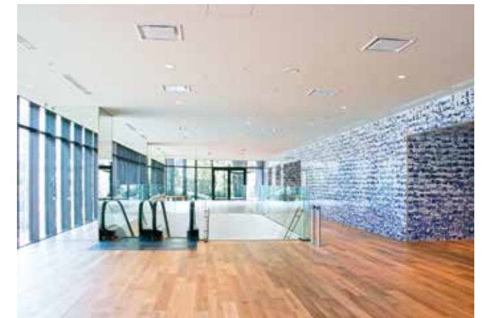
●2階ホールB ホワイエ