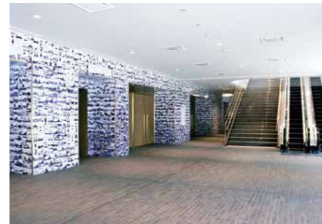
●1階ホールA ホワイエ