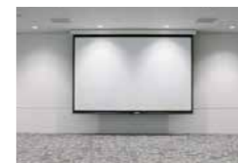
●スクリーンはホールAに2カ所、ホール B-1、B-2、B-3にそれぞれ1カ所。