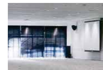
●電動ブラインドで調光可能。 (2階ホールB-3)