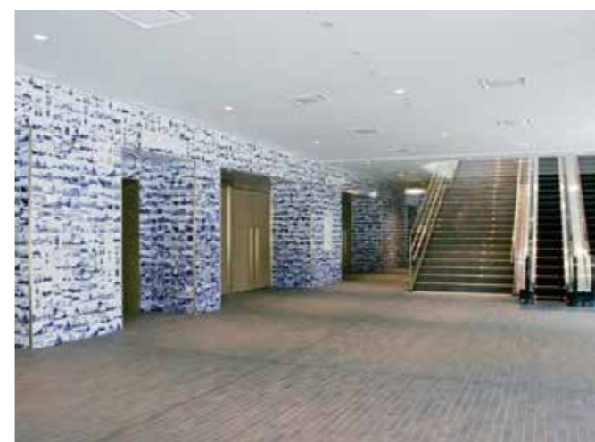
●ホールA(1階)ロワイエ