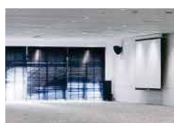
●電動ブラインドで調光可能。(2階ホールB-3)