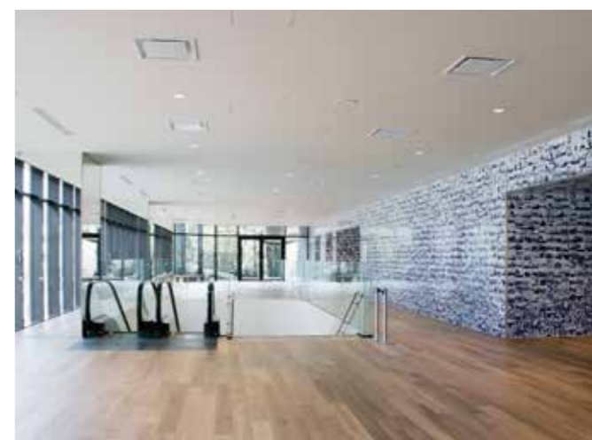
●ホールB(2階)ロワイエ