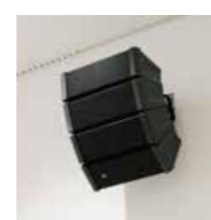
●音響はコンパクトスピーカーを採用。