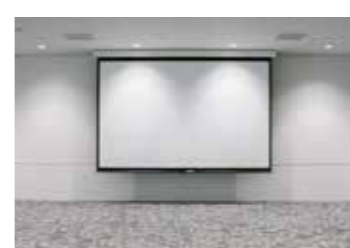
●スクリーンはホールAに2カ所、ホールB-1、B-2、B-3にそれぞれ1カ所。