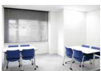
●控室は2階に4室を完備。喫煙スペースも有。